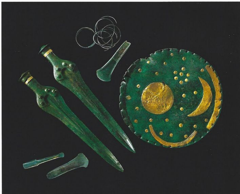
Abb. 1 Der Hortfund von Nebra, Burgenlandkreis, nach der Restaurierung mit der Himmelscheibe, zwei Schwertern, zwei Beilen, einem Meißel und zwei Armspiralen.

Beilen, einem Meißel und zwei Armspiralen sowie einer Bronzescheibe bestand, die fast vollständig mit anhaftender Erde bedeckt war (Abb. 1–2; 12; 15). Nach der anfänglichen und unsachgemäßen Reinigung dieser Scheibe kam ein Himmelsbild aus Goldeinlagen zum Vorschein. Wenige Tage später verkauften die Raubgräber den gesamten Fund an einen ersten Hehler. Fast drei Jahre später wurden die Himmelscheibe und weitere Objekte aus dem Hort nach einem erneuten Besitzerwechsel in einem Basler Hotel von den Schweizer Behörden beschlagnahmt. Durch nachfolgende polizeiliche Ermittlungen konnten die fehlenden Stücke sowie der Fundort aufgefunden gemacht werden.