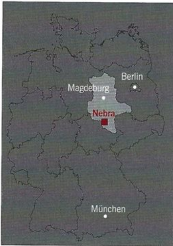
Abb. 2 Lage des Fundortes Nebra, Burgenlandkreis, im südlichen Sachsen-Anhalt.